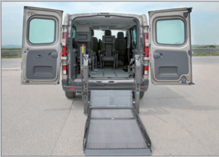
Doppel Arm Lifte - Élévateur à deux bras - Sollevatori a doppio braccio