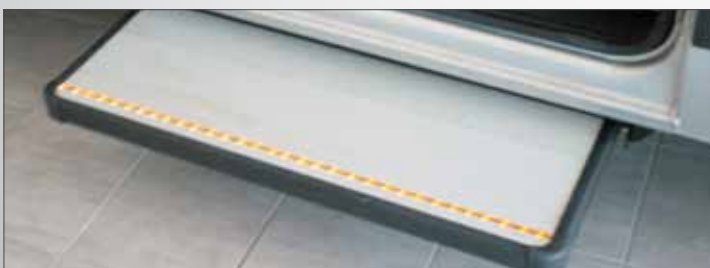
Seitliche Stufe "Shining Step" Marchepied d'entrée latérale "Shining Step" Gradino laterale "Shining Step"

Pavimento con sedili singoli scorrevoli e sganciabili su guida. Queste caratteristiche danno la possibilità di modulare la configurazione dei posti viaggio in funzione delle esigenze di trasporto.