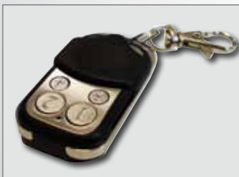
F-Remote Serienfernbedienung Radiocommande de série Radiocomando di serie