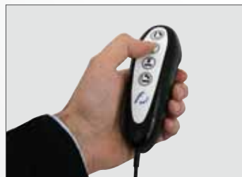
F-Wired Fakultative Kabelfernbedienung Télécommande à fil en option Telecomando a filo optional